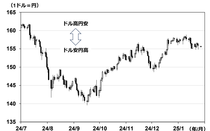
【図表②】 ドル円相場 (日足)

出所:LSEG Workspace 作成:岡三証券 日本時間1月27日午前8時時点